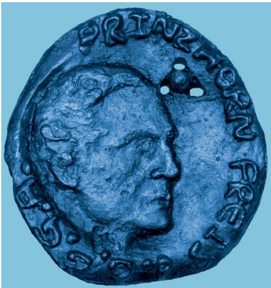
Hans Prinzhorn-Medaille (Anonymus)

50. Jahrestagung Impuls Prinzhorn 26. – 28.10.2017 Heidelberg